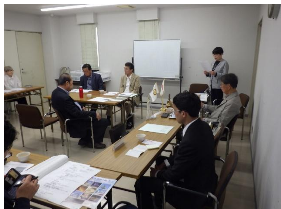
会報発行担当：川戸広樹

来月の予定といたしましては、まずは先述したラフマニノフの博物館でのコンサートを月末に控えております。そこでは今月の課題であったベートーヴェンのソナタとラフマニノフの作品を演奏する予定です。また、その直後、6 月初めにはルツェルンの歴史あるコンサートホール、KKL でのコンチェルトのコンサートが続きます。これは、大学の試験ではありますが、普通のコンサートとしても行われます。二つとも演奏家としてきわめて貴重な機会なので、精一杯準備して臨みたいと思います。