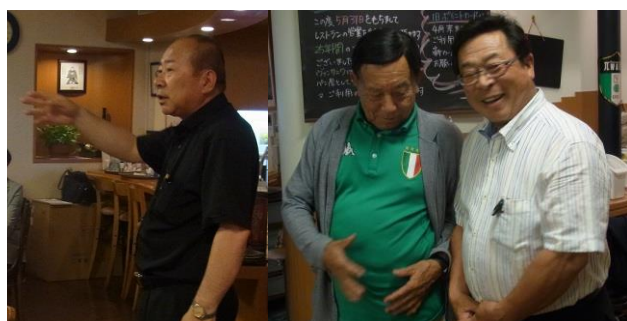
沖 親睦委員長の中締め